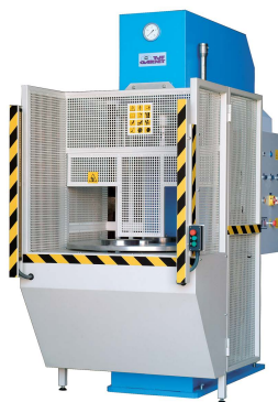
CM-100 E Indexed splitter plate with two stations