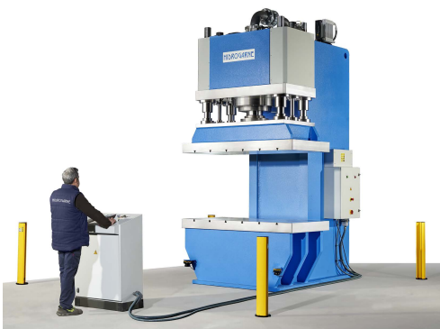
CM-400 E For straightening rails.