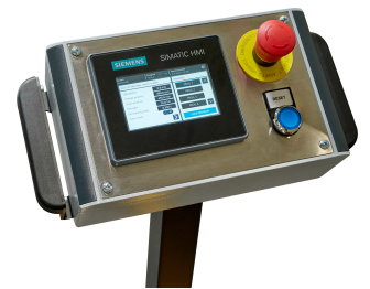
SIEMENS NC mod.MTP-400