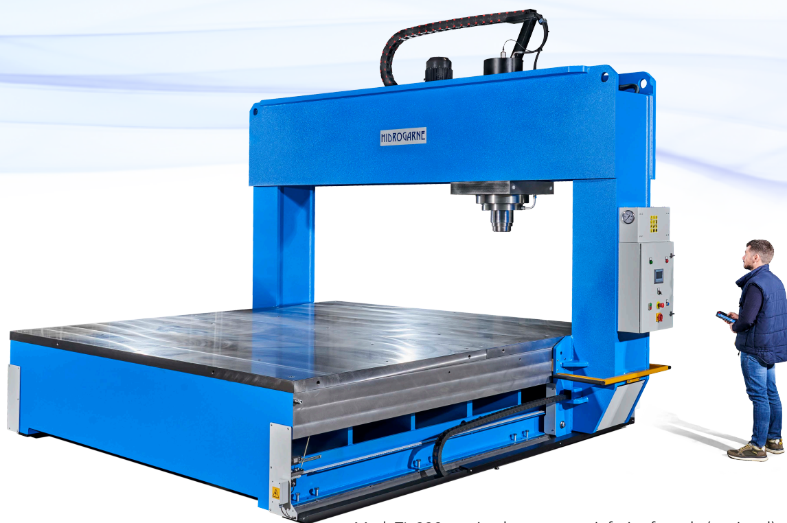
Mod. TL-220 equipada com mesa inferior fresada (opcional)