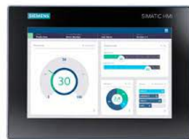
NC SIEMENS MTP-400